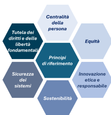
Figura 2 - I principi fondanti della strategia per l'introduzione dell'IA

La strategia per l'introduzione dell'IA è guidata dai seguenti principi di riferimento che costituiscono il fondamento delle politiche e delle azioni intraprese dal Ministero per affrontare con decisione e responsabilità le sfide del futuro, in coerenza con i valori costituzionali, a partire da quelli riconosciuti negli articoli 2 e 3 Cost., delineati ed ulteriormente articolati nelle politiche educative nazionali (art. 9, comma 1 Cost.) ed europee (art. 14 Carta dei diritti fondamentali dell'UE) 3 .